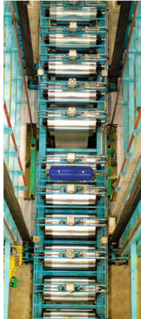
▲ 爱思凯上海光亮退火线