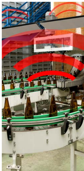
▲ Schematische Darstellung der Schallabsorption mit SonoPerf