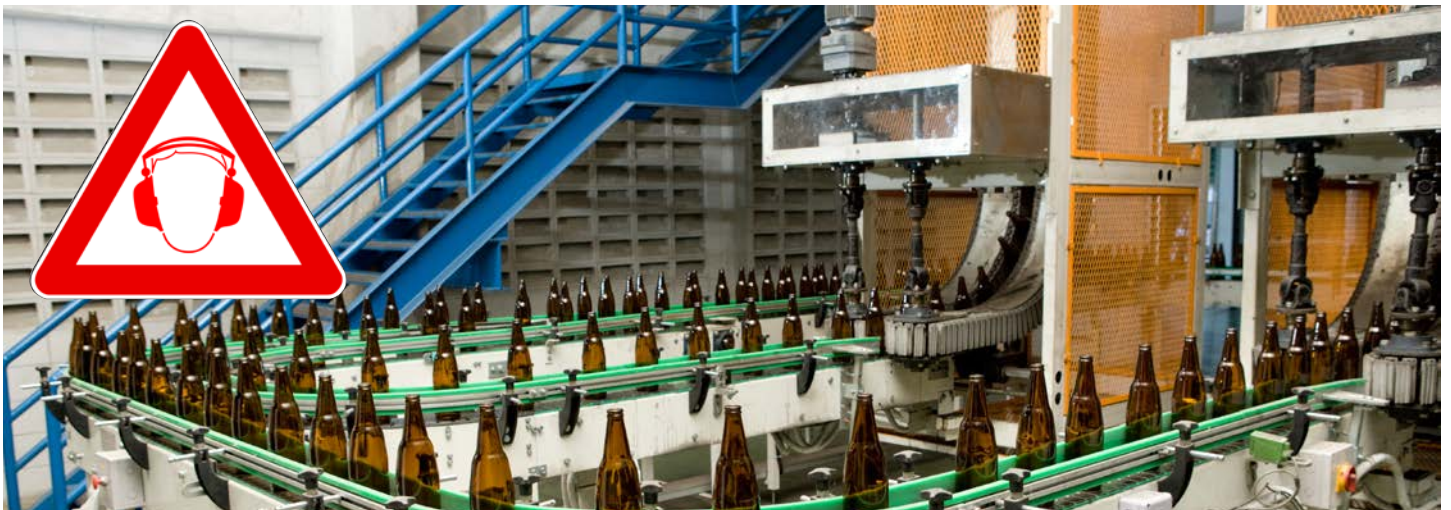
▲ Beispiel für ein lautes Arbeitsumfeld unter hygienischen Bedingungen