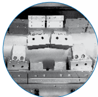
刀片由高强度特殊调质钢造成 ▶ 坚实、磨损少、便于更换