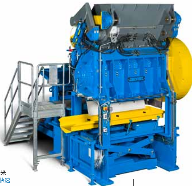
大型坚固的结构 ▶ 稳定性高、防震动