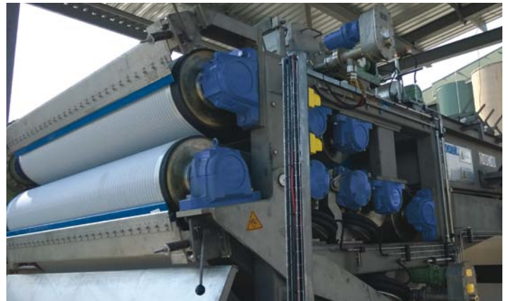
CPF河马浓缩机20用于对纤维含量高的污泥进行脱水 ▼