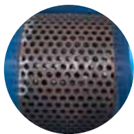
特制筛板，筛孔尺寸最大为100毫米 ▶ 使用灵活、磨损少、更换简单快速