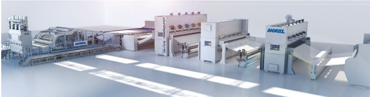
ANDRITZ neXline Hochleistungs-Nadelvlieslinie zur Herstellung von Geotextilien.