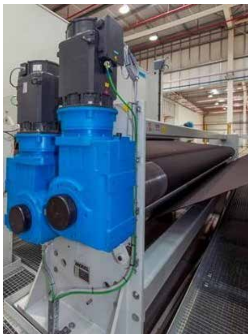
Einzigartige Vliesstrecke für perfekte Bahnkontrolle