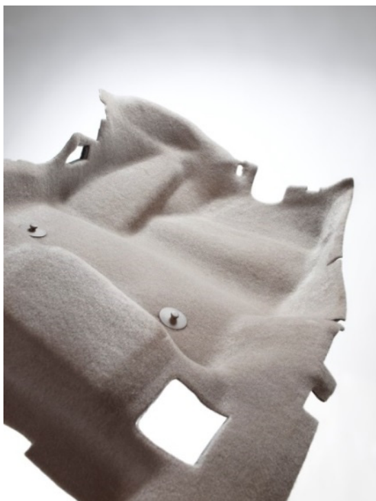
Vliesstoffteppich auf Basis Di-Light von Autoneum.