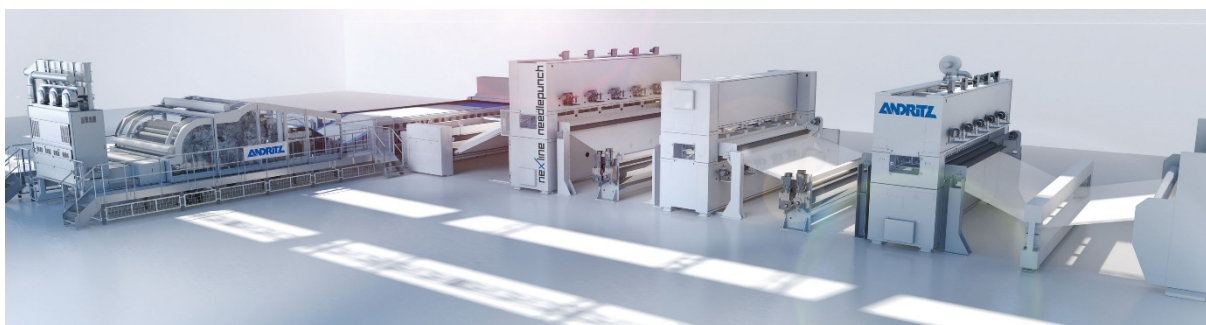
ANDRITZ eXcelle Hochleistungs-Nadelvlieslinie.