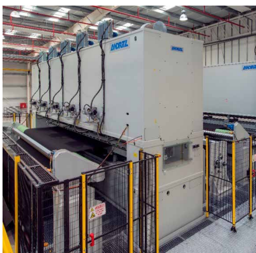
Robuste Nadelmaschinen für konstante Qualität.