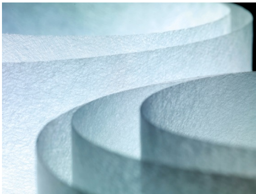
Glasfasermatten von Saint-Gobain ADFORS.