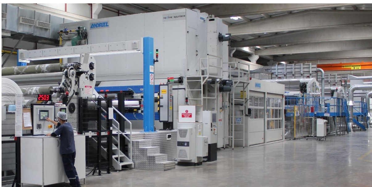
Spunlace-Linie von Karweb Nonwovens