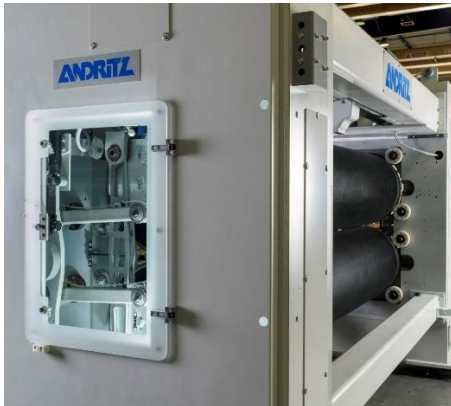
Elliptische Zylinder-Vorvernadelungsmaschine während der Montage (Werkstatt Elbeuf)