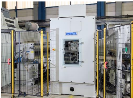
PA.3000 elliptische Zylinder-Vorvernadelungsmaschine im Technikum Elbeuf