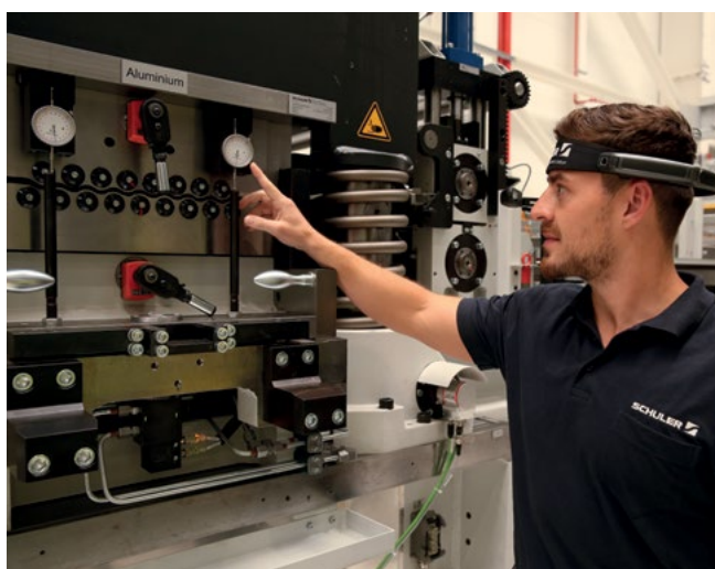
Der Anwender übermittelt das Sichtfeld seiner Smartglasses per Bild- oder Videoübertragung an den Schuler-Experten.