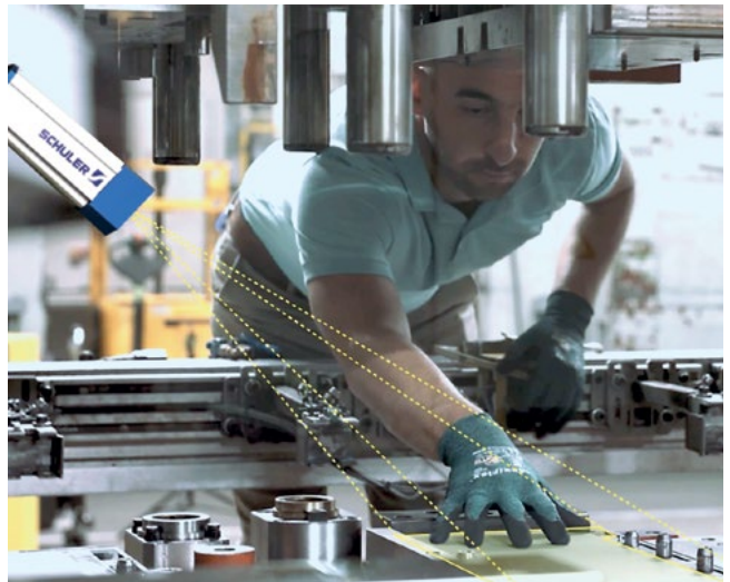
Metris Visual Die Protection erkennt Fremdkörper oder andere Gefahrenquellen in Echtzeit und stoppt die Anlage, bevor ein Schaden entsteht

Dank des einfachen Retrofits und dem breiten Verwendungsspektrum von Visual Die Protection profitieren Anwender schnell von unserem System. Neben dem Einsatz an Transferpressen, in Pressenstraßen oder für Folgeverbundwerkzeuge sind auch Anwendungen in der Kunststoffverarbeitung oder an Montagelinien möglich. Die Anbindung des Systems ist herstellerunabhängig und nicht auf die Umformtechnik beschränkt.