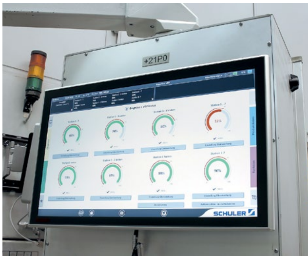
Eine Überwachung meldet einen Fehler.

Visual Die Protection ist schnell einsatzfähig, auch bei Fremdfabrikaten.