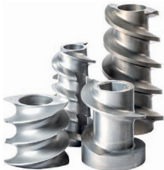
Roscas Simples e Duplos

Nosso extenso catálogo de peças de extrusão projetadas garante que você tenha acesso aos componentes da mais alta qualidade, desenvolvidos para atender a todas as demandas do seu negócio.